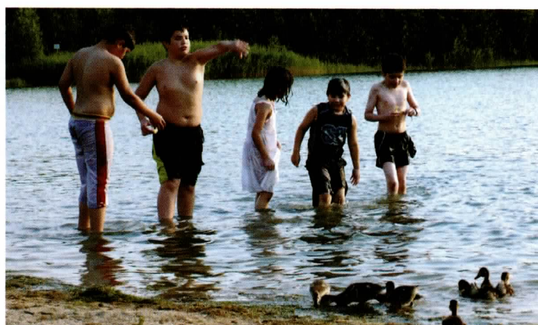
Die Entenfamilie kann auch vom Wasser aus gefüttert werden.

gente und Schwansbeller Weg überlagert bzw. in eine weitere Ebene transportiert wird. Die plastische Raumcollage findet durch die Bahnlinie, die sicht- und hörbar das Gebiet berührt, die Kanalschiffe und die Flugzeuge die den Luftraum kreuzen, eine weitere Steigerung. js