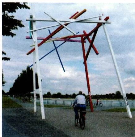
Das riesige Mikadospiel – eine Arbeit des Künstlers Ernst Reusch – zwischen See und Kanal ist aus allen Richtungen zu sehen, eine echte Landmarke.

Ganz neu ist das Spiel mit der Frisbee-Scheibe, die es in Körbe zu werfen gilt; die Ausleihe ist am Kiosk möglich. Nicht neu – aber für Interessierte immer wieder spannend – sind einige Besonderheiten: Das große Kunstwerk zwischen Kanal und See als Endpunkt der Sichtachse quer durch den Park schuf der international anerkannte Künstler Erich Reusch. Es sieht aus wie ein riesiges Mikadospiel und ist als Landmarke aus allen Himmelsrichtungen erkennbar. Die scheinbare Instabilität der Plastik zitiert die Bewegung des Bodens im Bergschadengebiet. Aus jeder Perspektive sieht der 10 Meter hohe »Wegweiser« anders aus.