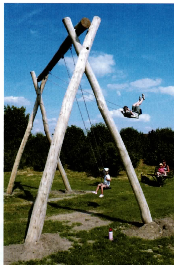
Hoch hinaus geht's mit der Schaukel auf mehreren Spielplätzen, die von Familien gerne frequentiert werden.

Den Wettbewerb zur Gestaltung der kaputten Region, gleichsam zur Landschaft im Riss, gewann damals das Büro für Freiraumplanung, Werner Schupp und Reiner Thiel aus Münster. Sie schufen eine Parkästhetik, die auch vor den Richtlinien der IBA (Internationale Bauausstellung Emscherpark) Gnade fand. Wer wachen Auges durch den Seepark geht, erkennt die Kunstlandschaft durchaus als Kunstwerk. Beim Durchwandern immer neuer Räume lassen sich Orte unterschiedlicher Qualitäten erleben. Künstlich geformte Kanten, angeschüttete Hügel, steinerne Linien, Plattenstreifen, achsiale Kieswege, Rissfiguren sind spannungsreich gegen weiche Konturen gesetzt. Steine, Erde, Gras und Wasser bilden ein Gefüge, das von Kanal, Hochspannungsleitungen, Seseke-Tan-