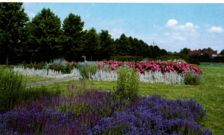
Gepflegter Blickfang auf den Wiesen: die Stauden- und Rosenbeete